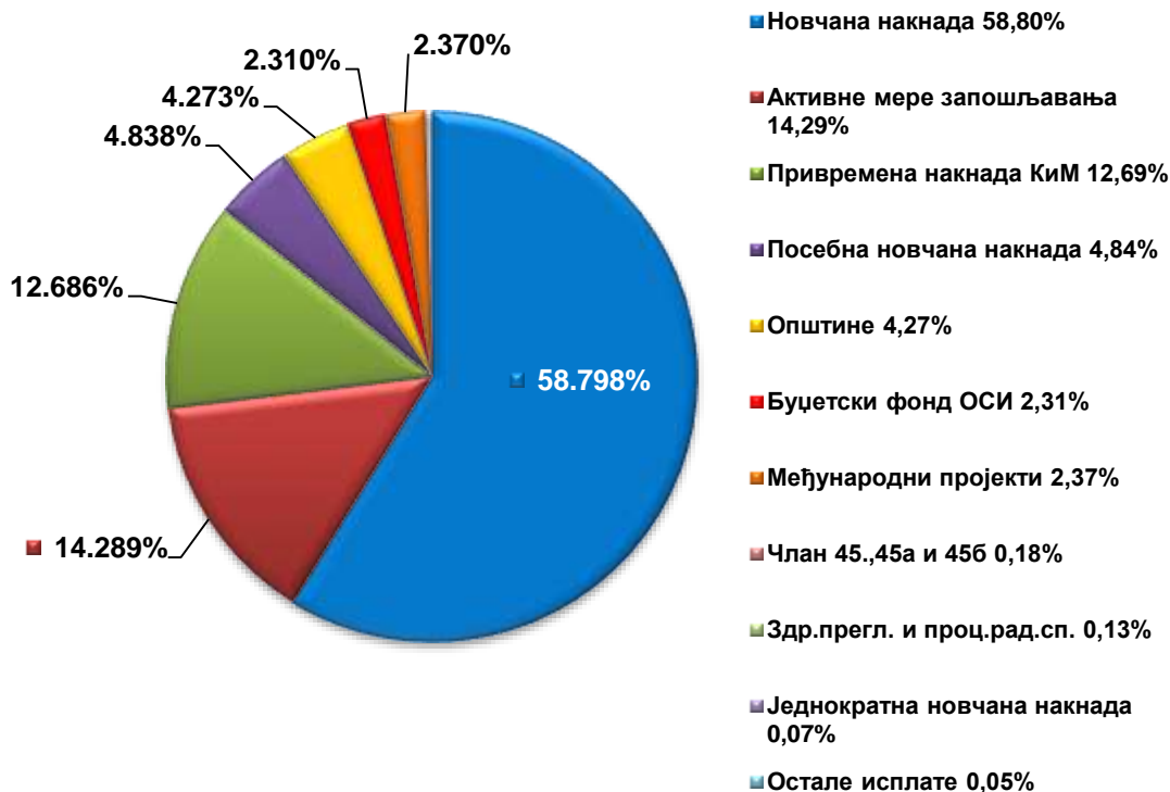
Графикон Структура расхода категорије 47 - социјално осигурање и социјална заштита