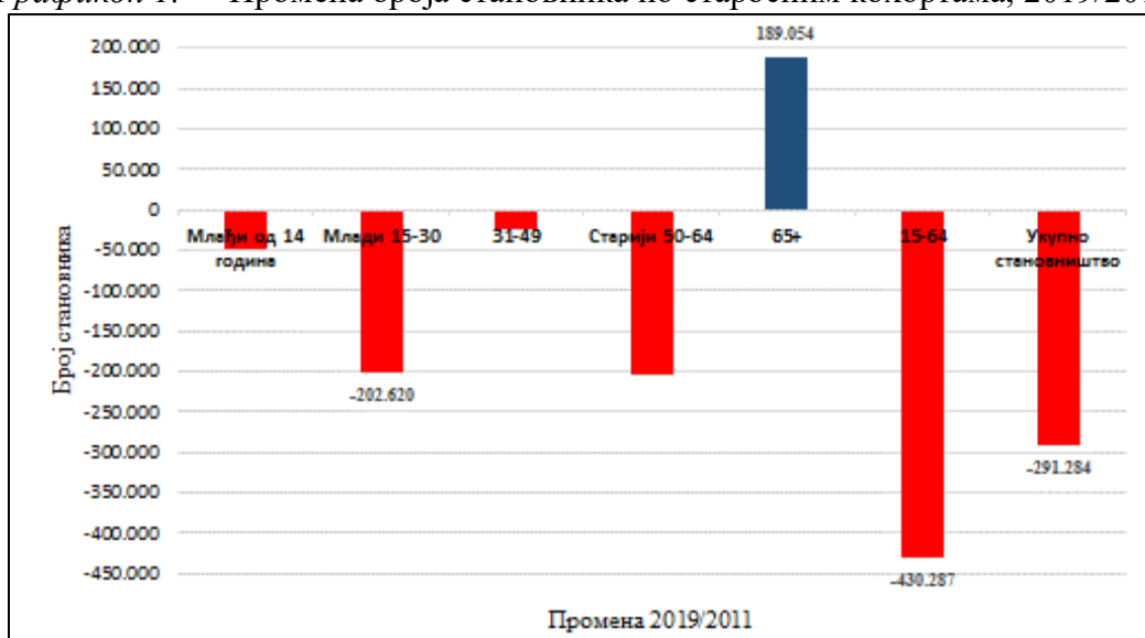
Графикон 1. Промена броја становника по старосним кохортама, 2019/2011

Изразит депопулациони тренд је карактеристика демографских кретања у Републици Србији у последњој, али и претходној деценији. Број становника смањен је за нешто више од 291 хиљаде лица у 2019. години 5 у односу на податке Пописа из 2011. године. Демографска транзиција нарочито утиче на смањење становништва радног узраста (становништво 15–64, смањење за око 430 хиљада лица), посебно кохорте младих у овој категорији становништва (млади 15–30, смањење од 202,6 хиљада лица).