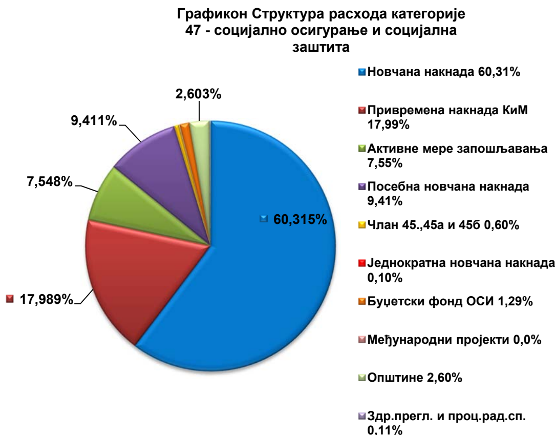
Графикон 2 – Структура расхода категорије 47 – социјално осигурање и социјална заштита

За реализацију мера активне политике запошљавања по Програму распореда и коришћења средстава дотација организацијама обавезног социјалног осигурања из Буџета РС за 2015. годину, исплаћено је 1.895.535.392,61 динара. Од тога за активно тражење посла исплаћено је 1.112.837,00 динара, за додатно образовање и обуке 291.529.028,53 динара, за субвенције за запошљавање 1.069.618.357,15 динара, за јавне радове је исплаћено 484.976.365,82 динара, док је за преузете обавезе исплаћено 48.298.804,11 динара.