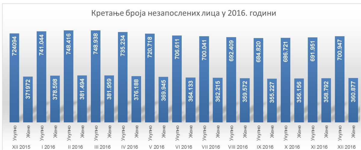
Графикон 1 – Кретање незапослености у периоду децембар 2015. - децембар 2016. године

У извештајном периоду, број незапослених је најпре растао до марта, када је достигао свој максимум (748.938), након чега се бележи пад до септембра, када број незапослених износи 684.820 и поново почиње да расте. Просечна месечна вредност броја незапослених лица у текућој години износи 713.154, што је за 30.004 лица (4,04%) мање него претходне године у истом периоду.