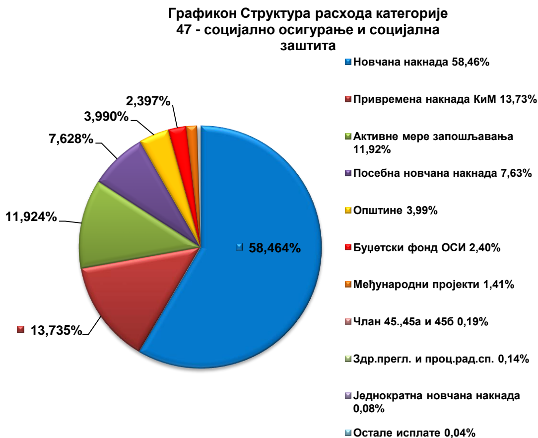
Графикон 2 – Структура расхода категорије 47 – социјално осигурање и социјална заштита

За реализацију мера активне политике запошљавања по Програму распореда средстава по мерама активне политике запошљавања за 2017. годину, исплаћено је 2.367.914.426,59 динара. Од тога за активно тражење посла исплаћено је 1.370.752,16 динара, за додатно образовање и обуке 696.309.167,54 динара, за субвенције за запошљавање 1.140.418.447,08 динара, док је за јавне радове исплаћено 529.816.059,81 динара.